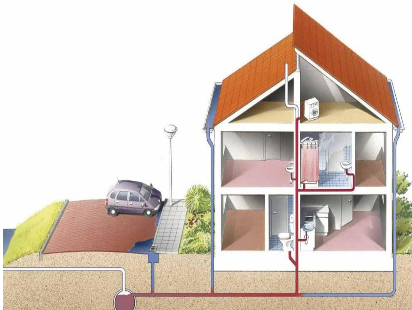
Gemengd rioelstelsel (Paul Maas, Tilburg/Stichting RIONED)

Wanneer de ontlufter op het dak van uw woning niet goed werkt dan zoekt de lucht een andere weg en kan deze via de binnenriolering de woning binnen komen. Controleer daarom de ontlufter op het dak. Het kan voorkomen dat deze dicht zit met bijvoorbeeld bladeren of vogelnestjes.