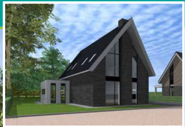
Impressies deelgebied 6

Het plangebied is bouwrijp. U kunt dus snel met de bouwactiviteiten starten.