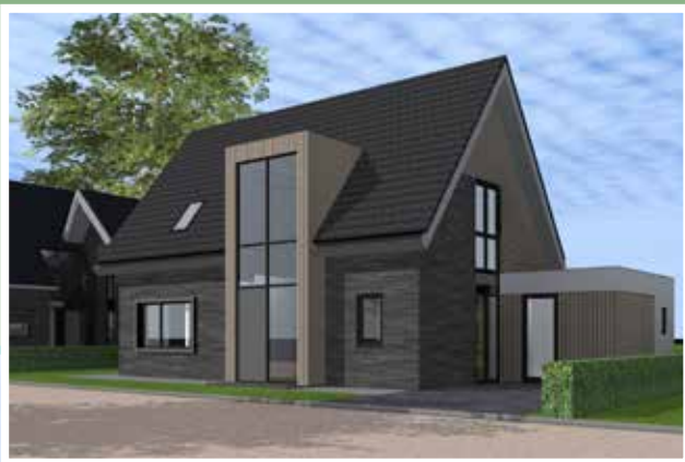
Impressie Kreekrug 20 voor

Heeft u serieuze belangstelling voor een kavel, maar bent u nog niet helemaal zeker van de koop? Vraag dan om de kavel een maand in optie te krijgen. Deze optietermijn is vrijblijvend en kosteloos. Heeft u uw beslissing genomen? Dan tekent u de koopovereenkomst. Hierbij betaalt u een aanbetaling van € 10.000. Bij het notarieel transport van de grond betaalt u de hele koopsom met aftrek van de aanbetaling. De gemeente houdt zich het recht voor de koopsommen van (niet verkochte) kavels tussentijds aan te passen.